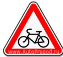
Знак 1.24 «Пересечение с велосипедной дорожкой»

Движение велосипедистов старше 14 лет возможно в порядке убывания: