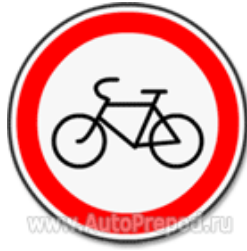
Знак 3.9 «Движение на велосипедах запрещено»