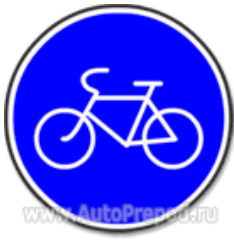
Знак 4.4 «Велосипедная дорожка»